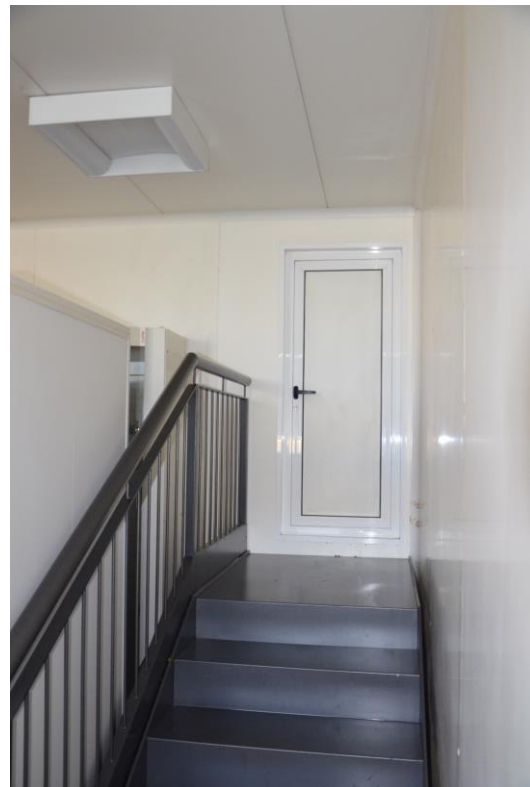
25. Accesso al sottotetto locale macchine