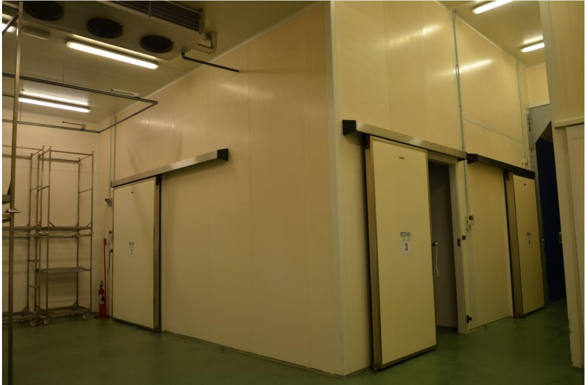
14. Celle frigo interne