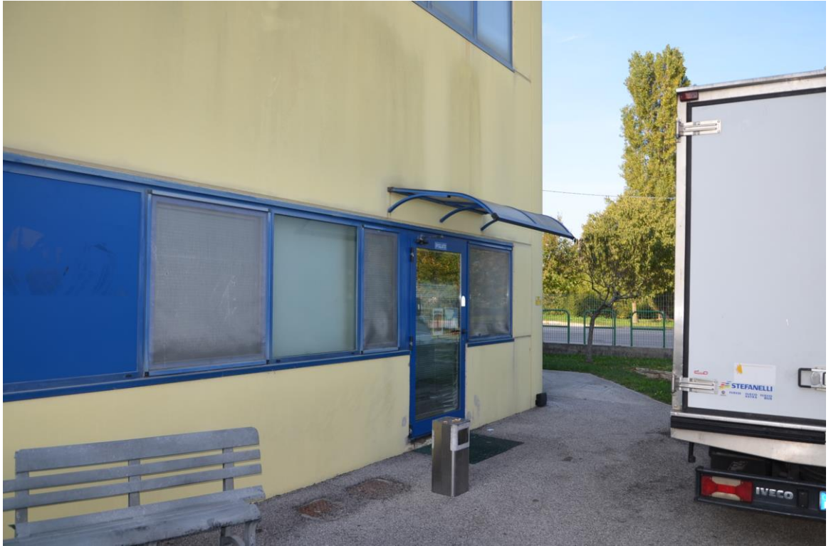
11. Particolare serramenti angolo nord est