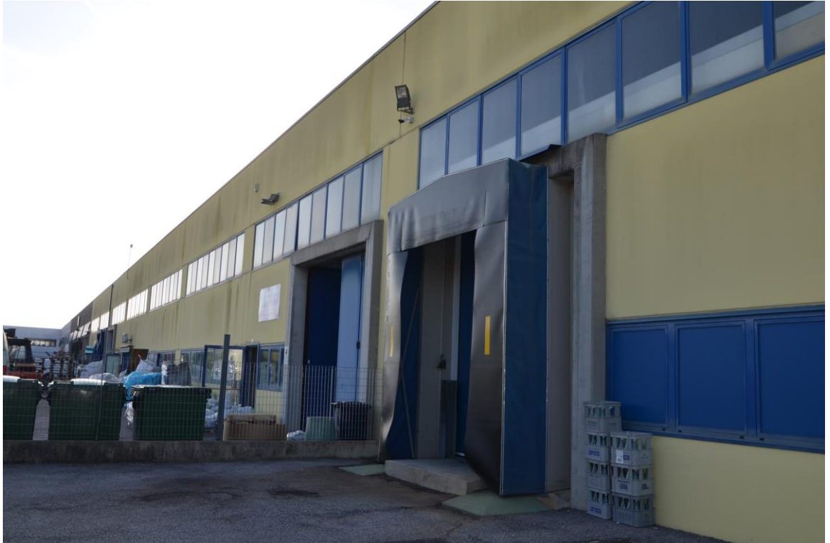
6. Portone di accesso lato sud est