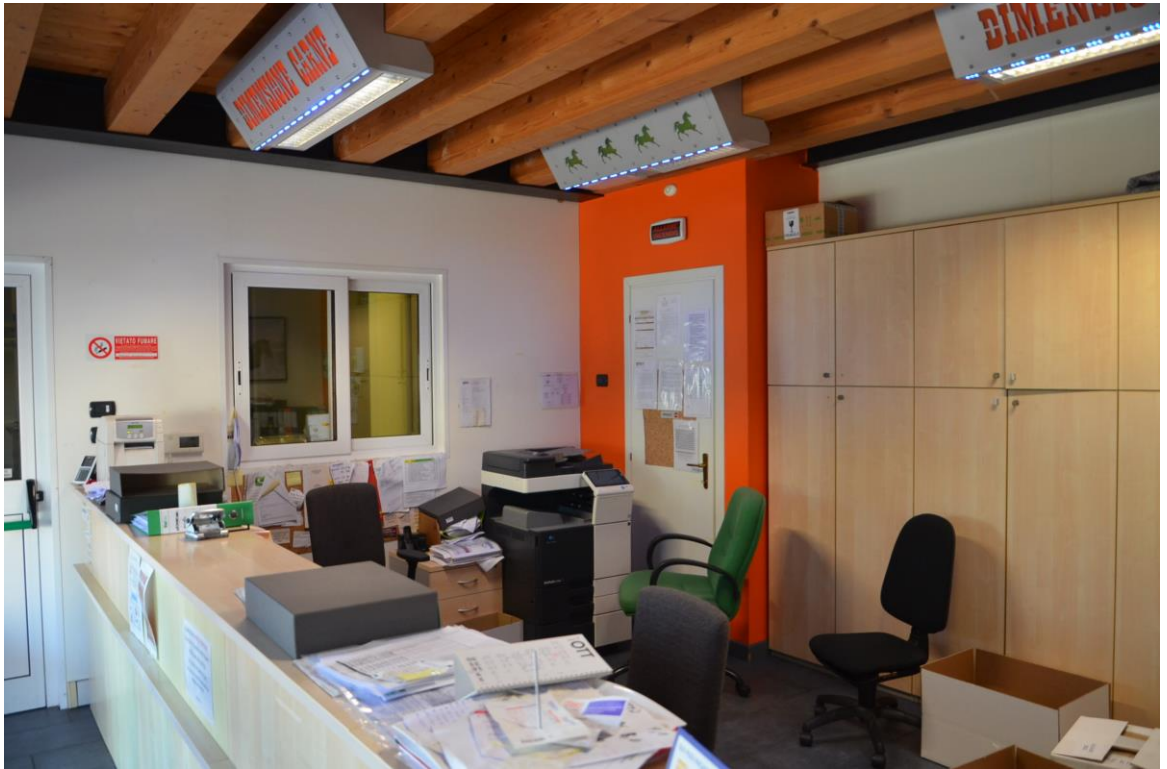
13. Ingresso – ufficio piano terra