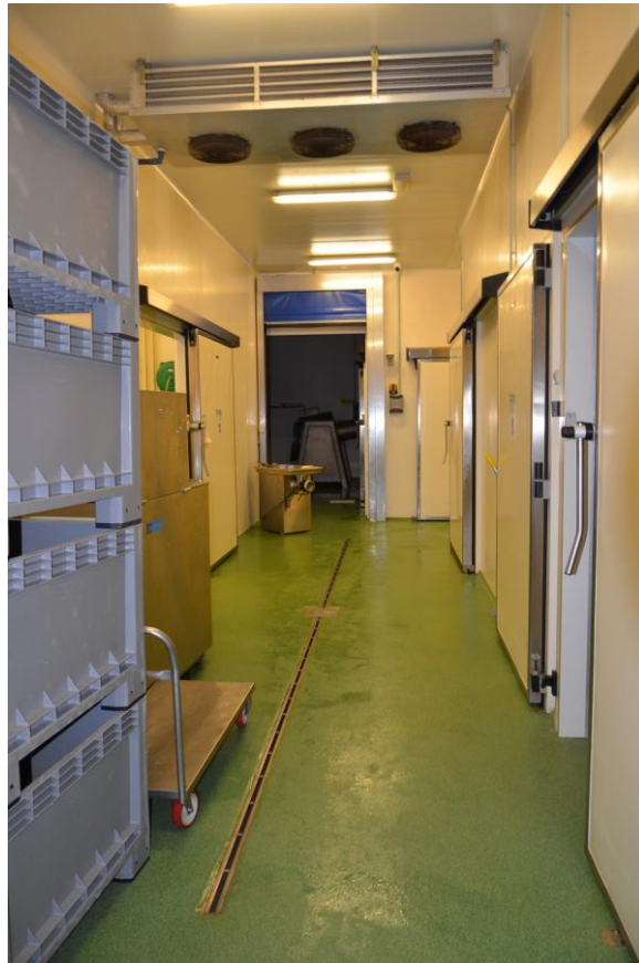
15. Distribuzione interna