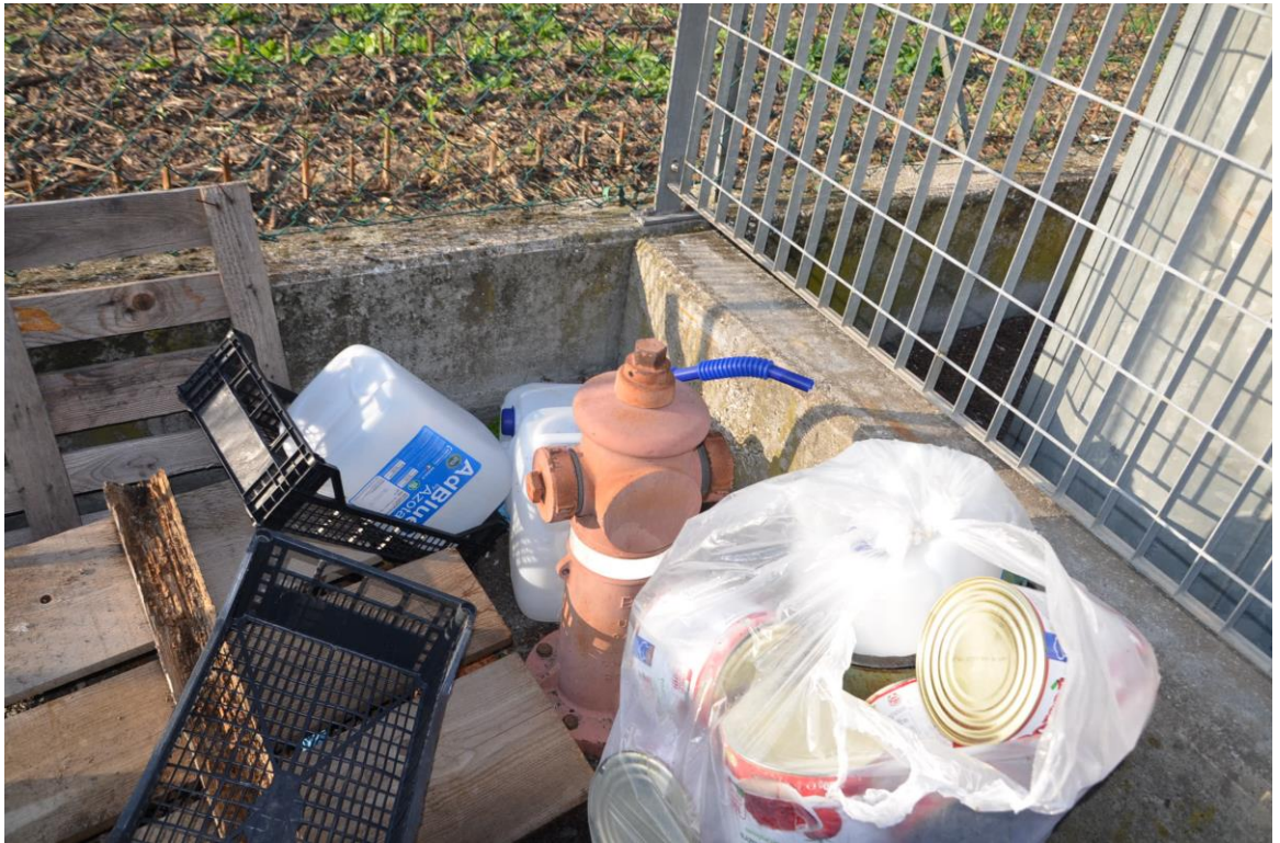
9. Attacco motopompa angolo nord del lotto