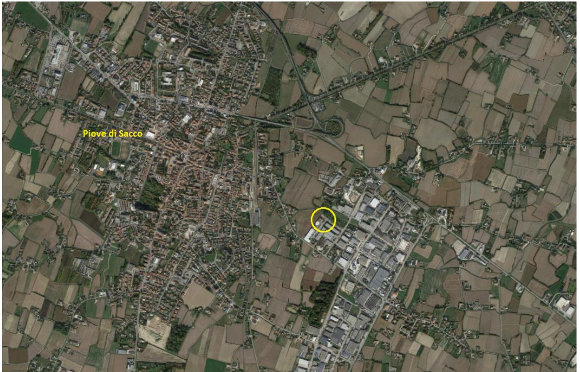
1. Inquadramento territoriale