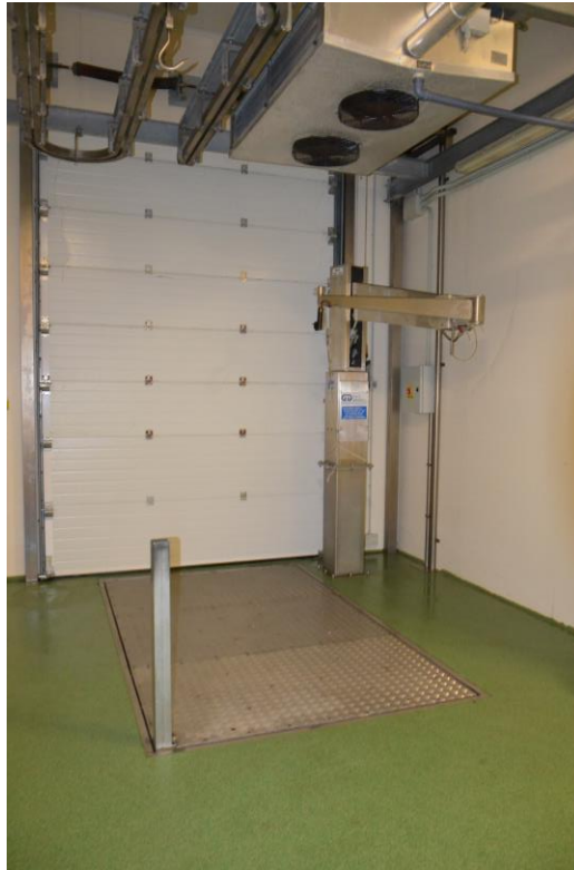
19. portone sezionale coibentato su esterno