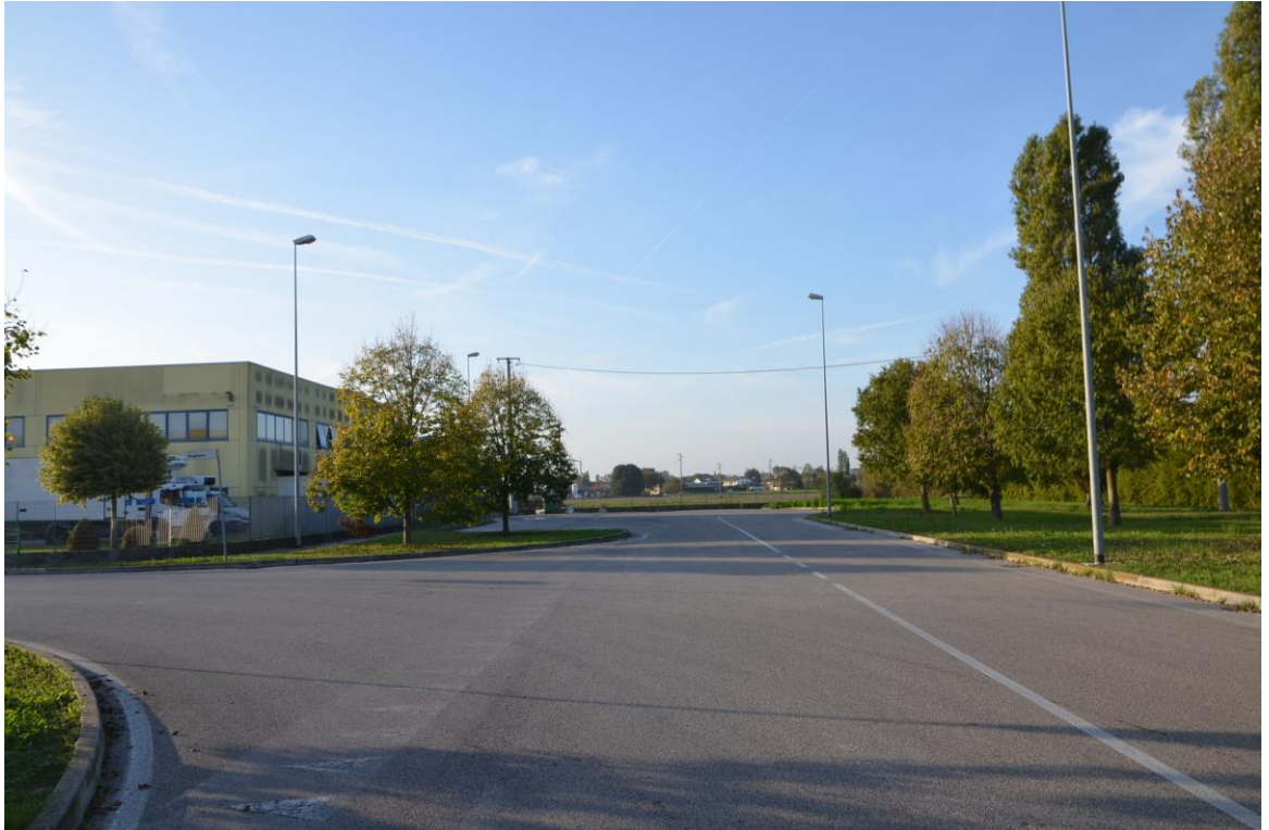
4. Prospetto nord su strada chiusa