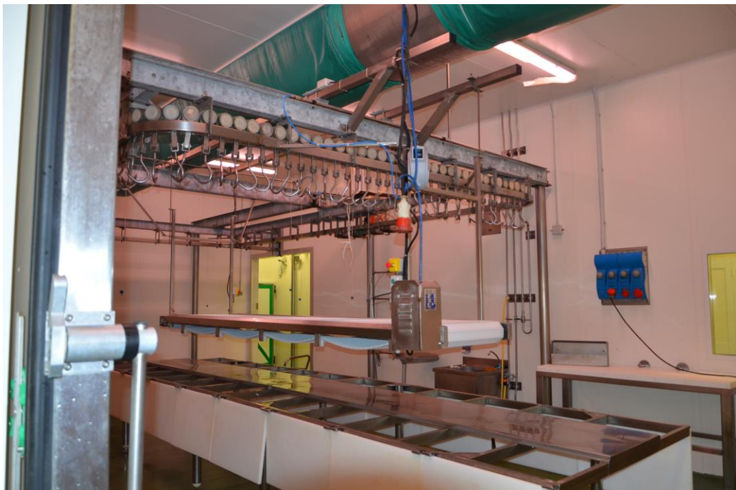
18. zona trasformazione carne