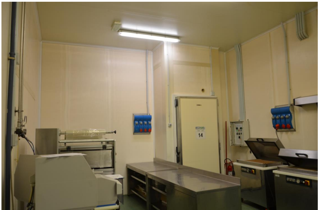
16. Zona di lavoro