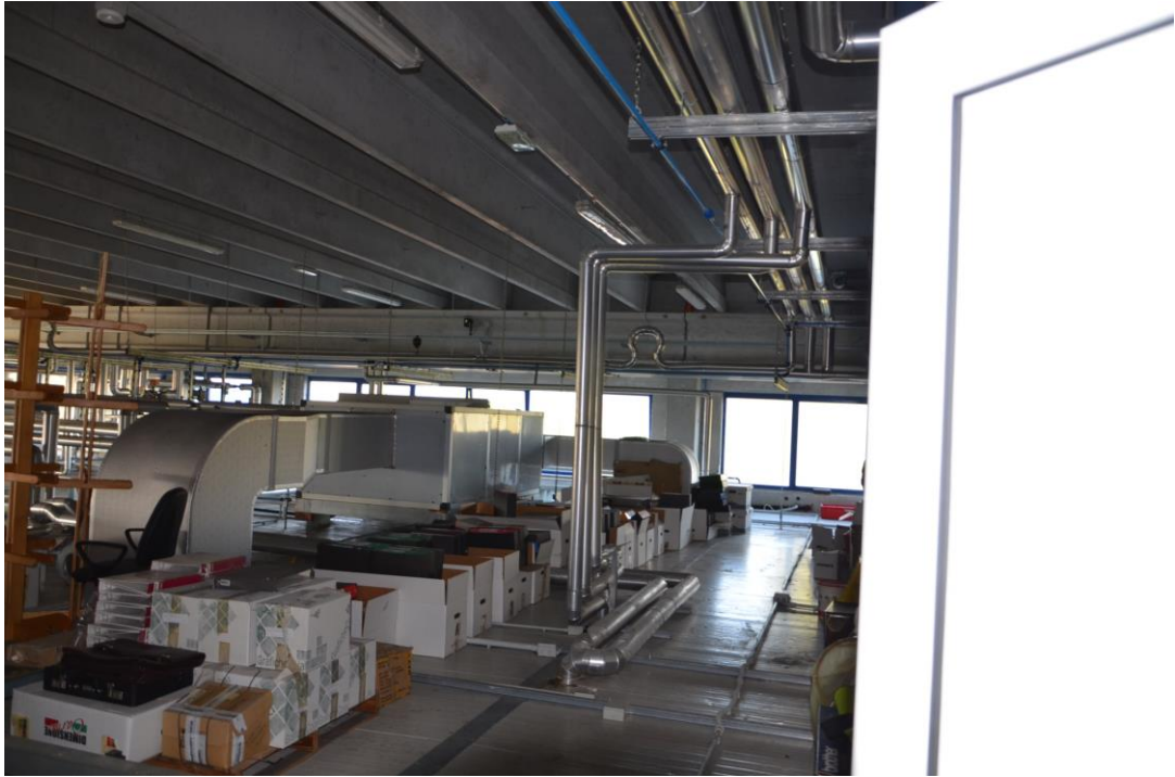
26. sottotetto zona macchine