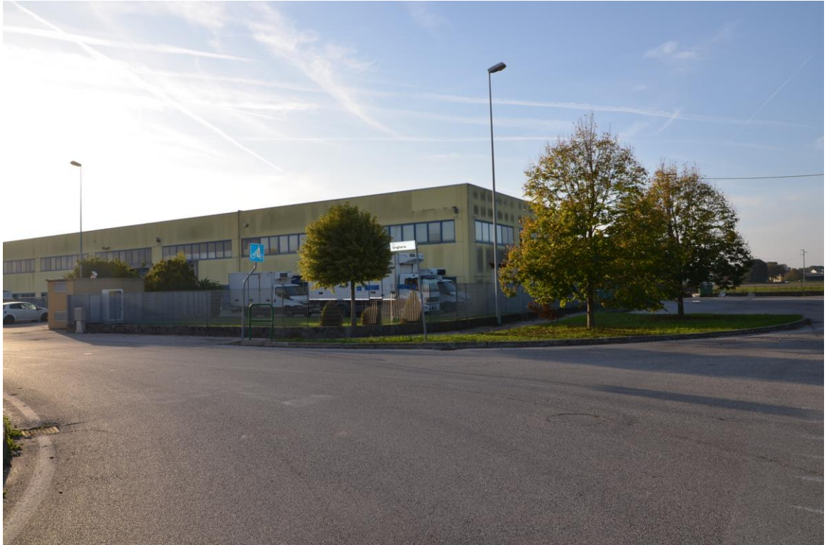
3. Prospetto est