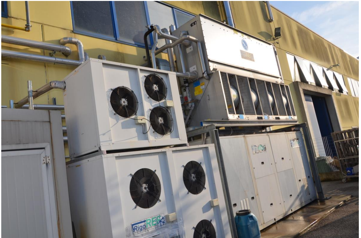
7. Zona impianti meccanici lato nord ovest