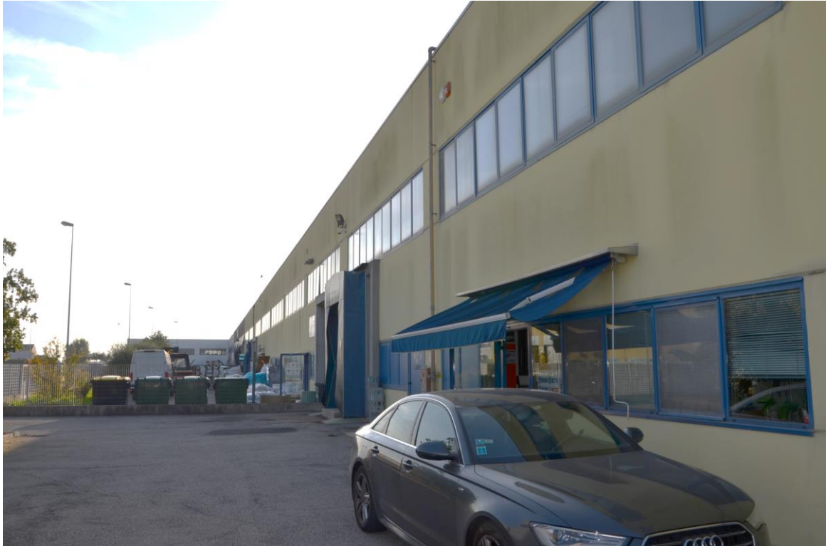
5. Prospetto est