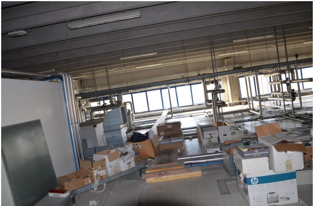
27. sottotetto zona macchine