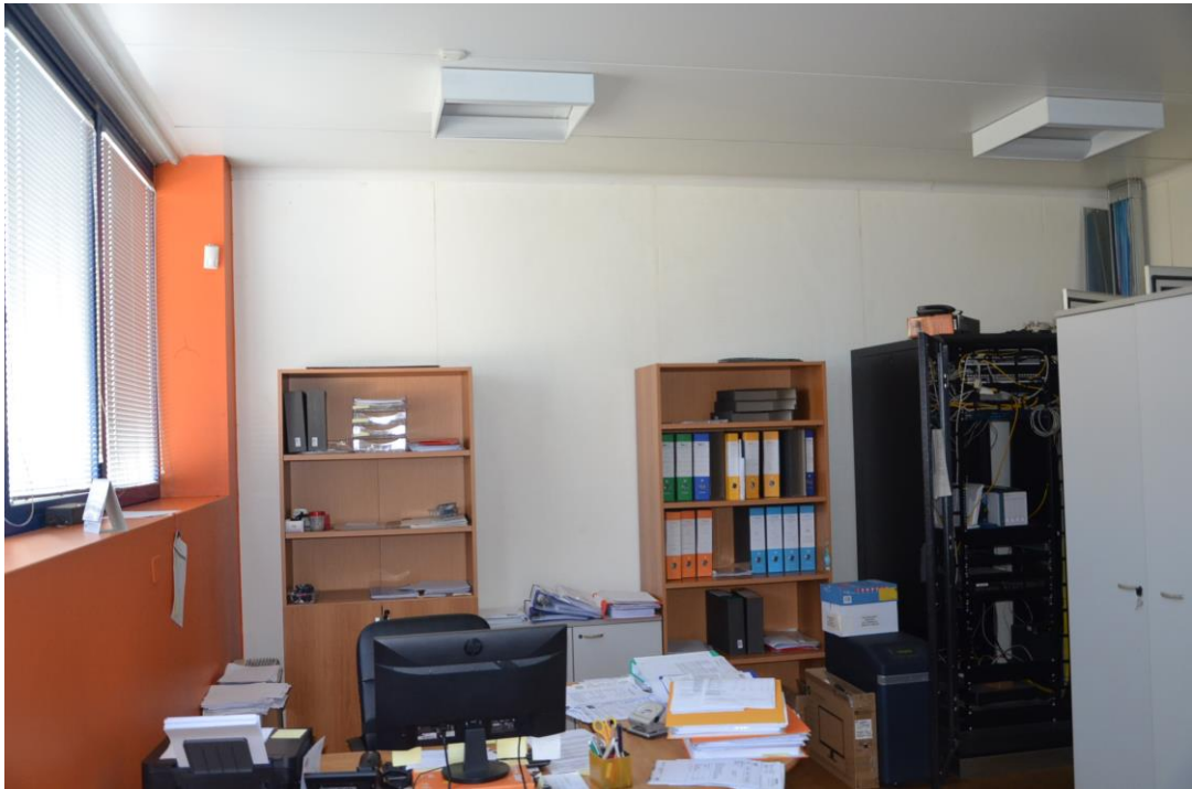
23. ufficio sala server piano primo