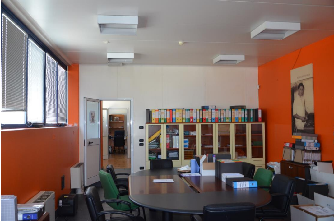
21. ufficio sala riunioni piano primo