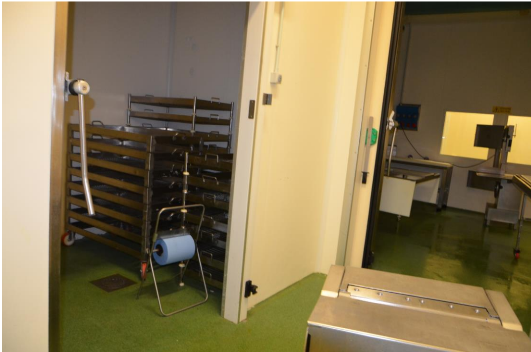
17. Distributivo interno particolare