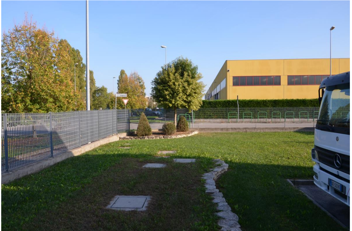
12. Particolare scoperto nord est