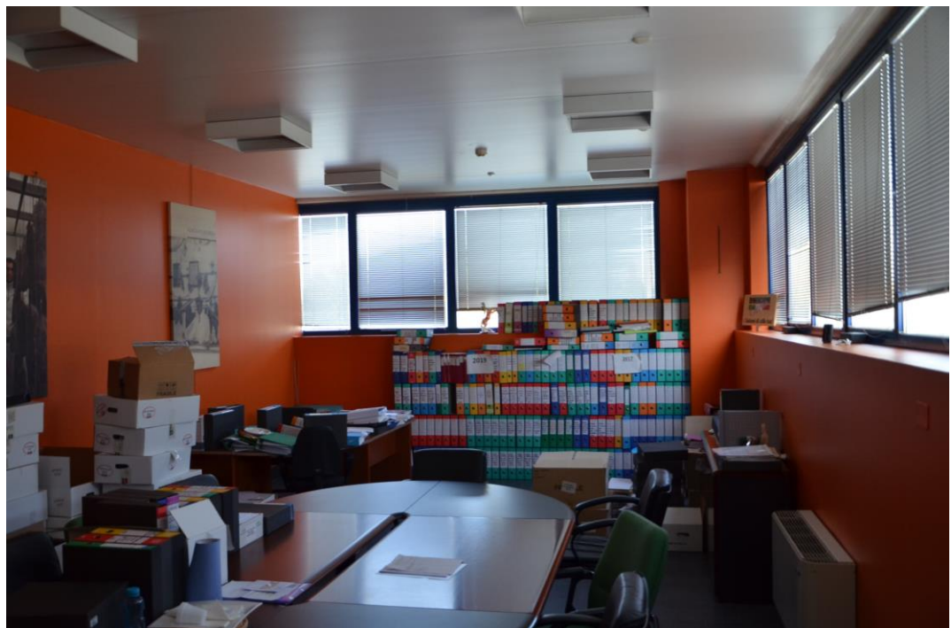
22. ufficio sala riunioni piano primo