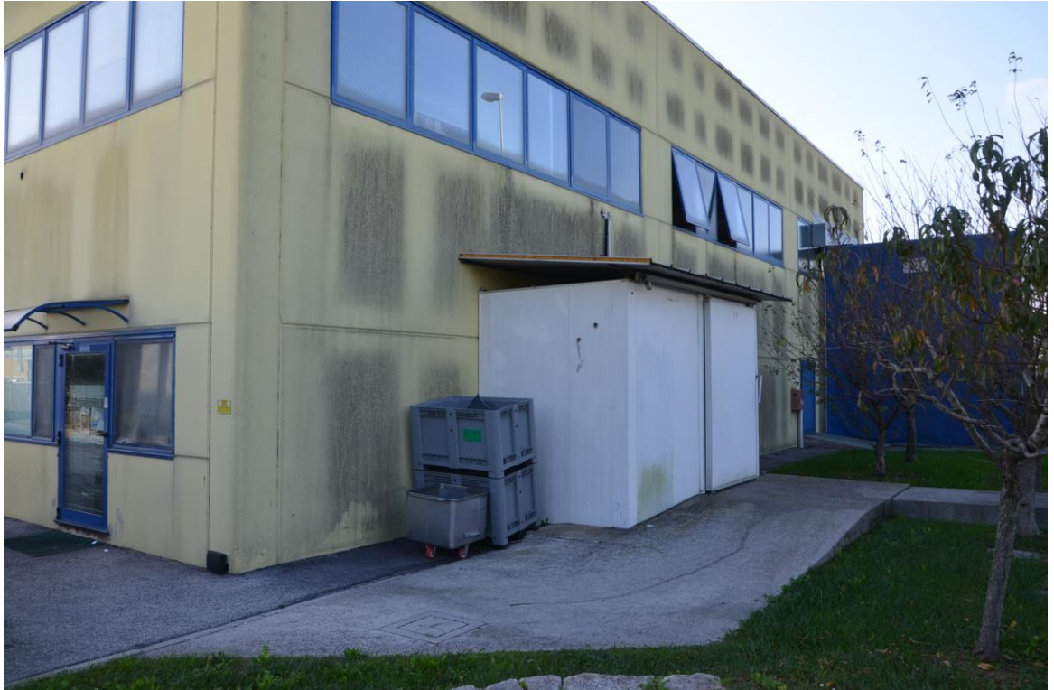
10. Prospetto nord - particolare