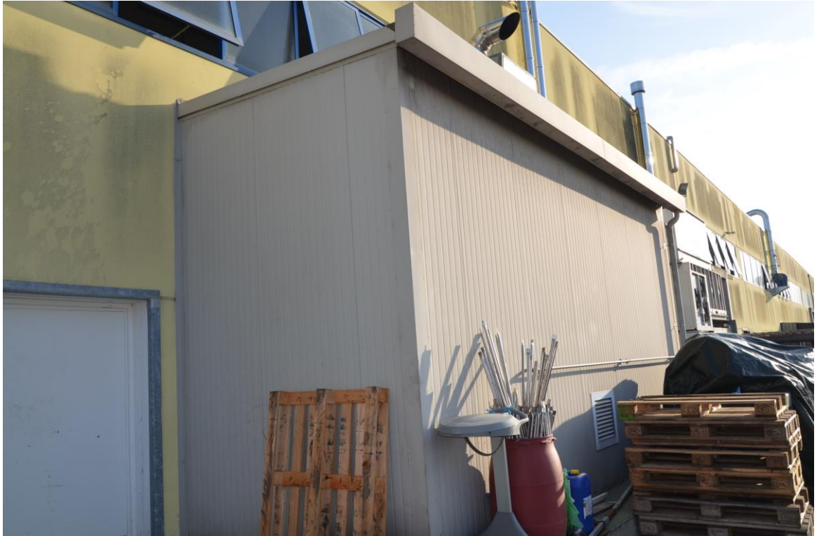
8. Zona impianti meccanici lato nord ovest