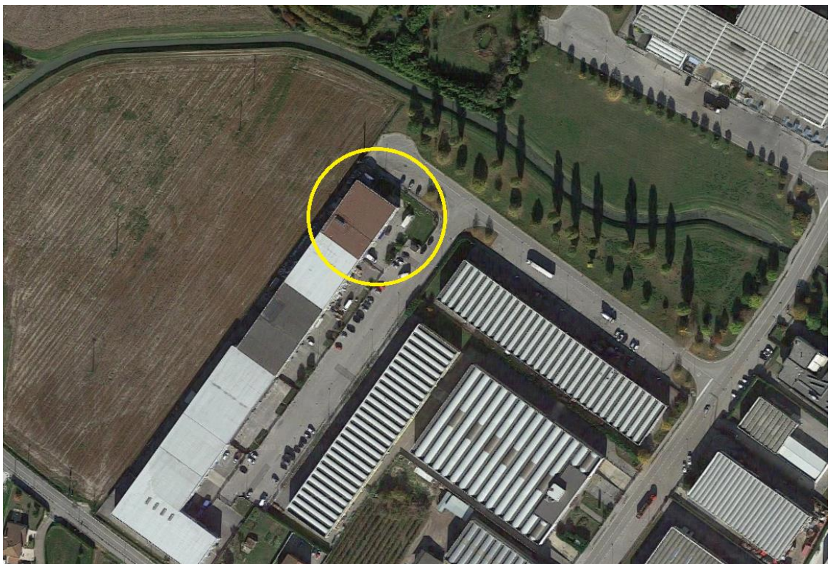
2. Inquadramento territoriale