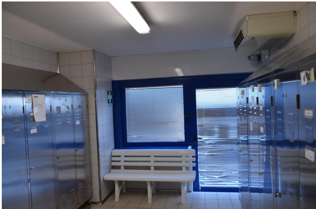
20. particolare spogliatoio